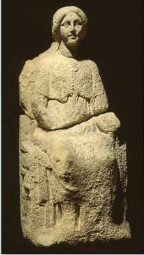
* Als Nehalennia eens kon praten...