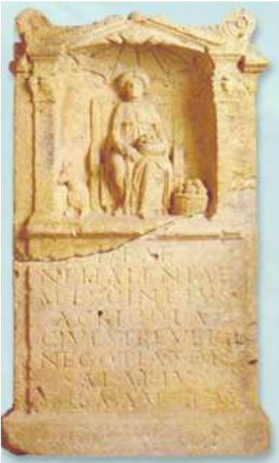
* 2000 jaar geleden werd hiervoor gebeden.

Van de tempel zelf weten we niets. In de 3e eeuw sloeg de zee grote stukken van de Nederlandse kust weg. De tempel van Nehalennia stortte in zee en werd bedekt met een laag zand. En niemand die nog weet waar die tempel precies gestaan heeft!